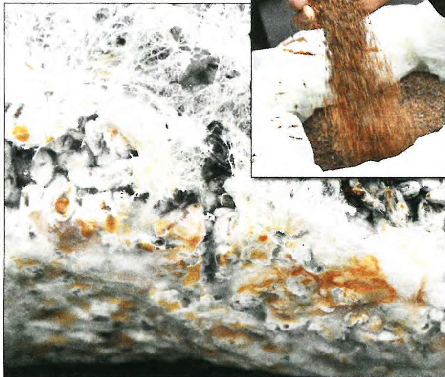
Scelta gebruikt alleen de schimmeldraden van de amandelpaddenstoel. Die worden geteeld op rogge en daarna, voordat zich een hoedje vormt, mild gedroogd en gemalen.