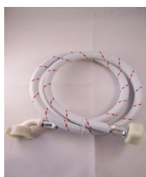
EPDM slang met mantel