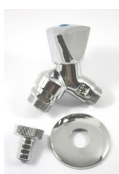
Kraan met keerklep