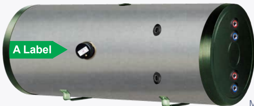
Model: PAWT-H XL LE1